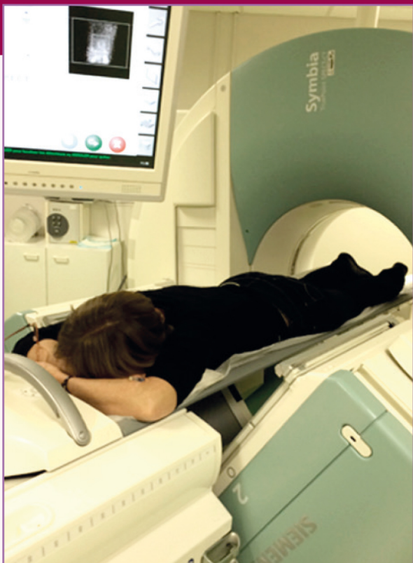
Exemple d'installation sous caméra scintigraphique

A la demande, la notice d'information du produit qui vous a été administré est consultable à l'accueil du service ou sur internet à l'adresse :